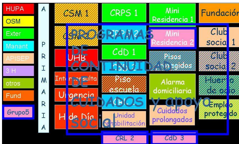
Figura 4. Principales proveedores de la red

(pensadas para atender funciones cuya complejidad requiere de un grupo de trabajo) están integradas por representantes de los dispositivos elegidos por los equipos interprofesionales de éstos.